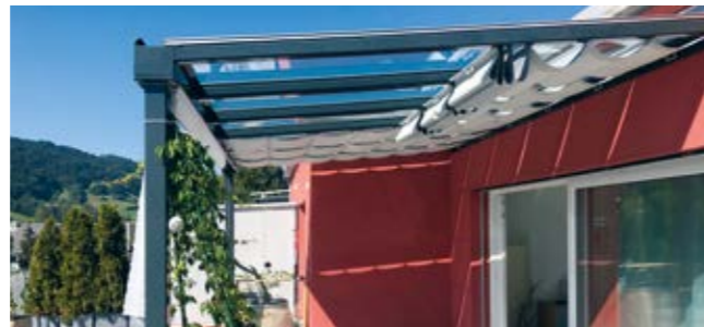
Loft Schräg- und Horizontalbeschattung