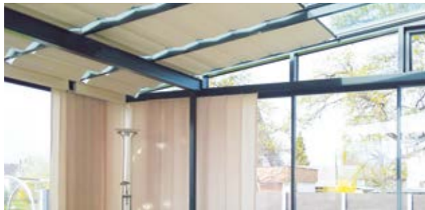
Hortus Schräg- und Horizontalbeschattung