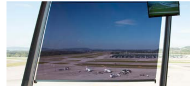
Spezialrollo für Tower