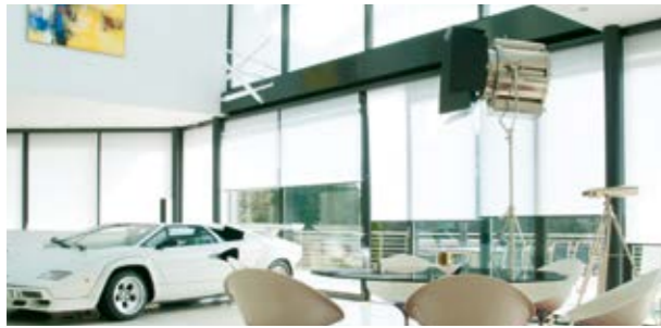
Rollo mit Gewebe