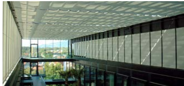
Oscuro Schräg- und Horizontalbeschattung