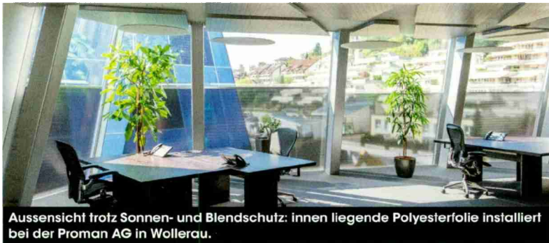
Aussensicht trotz Sonnen- und Blendschutz: innen liegende Polyesterfolie installiert bei der Proman AG in Wollerau.

MODERNE BÜROGEBÄUDE MIT GLASFASSADE UND GROSSFLÄCHIGEN FENSTERFRONTEN BIETEN SO MANCHEN KOMFORT: VIEL TAGESLICHT, DADURCH GRÖSSER ERSCHEINENDE RÄUME UND EINE TRANSPARENTE VERBINDUNG ZUR AUSSENUMGEBUNG. DOCH ES GIBT AUCH SCHATTENSEITEN: HITZE UND STARKE SONNENEINSTRALUNG. DIESE BEIDEN FAKTOREN LASSEN DAS ARBEITEN AM BILDSCHIRM IN DEN GLÄSERNEN BÜROKOMPLEXEN ZUR QUAL WERDEN.