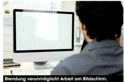
Blendung verunmöglicht Arbeit am Bildschirm.

W er kennt dies nicht? Kaum scheint die Sonne, gehen die Storen runter und das Licht an. Die direkte Sonneneinstrahlung verunmöglicht das Arbeiten am Bildschirm. Trotz der geschlossenen Storen staut sich im Büro eine unzumutbare Hitze, so dass die Klimaanlage – wenn überhaupt vorhanden – auf Hochtouren läuft. Das Resultat: Die Energiekosten steigen und das wertvolle Tageslicht bleibt draussen. Das hat Auswirkungen auf das Raumklima sowie das Wohlbefinden und die Leistung der Mitarbeiter.