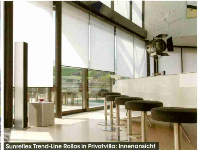
Sunreflex Trend-Line Rollos in Privatvilla: Innenansicht