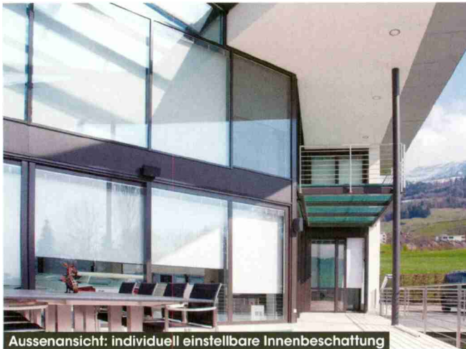
Aussenansicht: individuell einstellbare Innenbeschattung

Themen-Nr.: 666.009 Abo-Nr.: 1074805 Seite: 121 Fläche: 56'742 mm 2